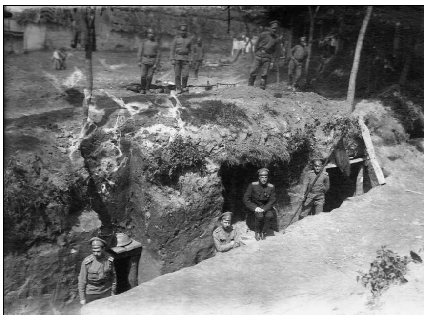
Офицерский состав 61-го пехотного Владимирского полка у штабного блиндажа. Село Куровцы, Украина. 20 мая 1916 г.