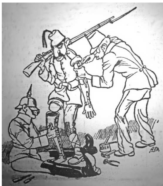
Турция готовится к войне с Россией (В австро-венгерской ортопедической мастерской) Рис. А. Воронцового (Приазовский край. 1914. 10 августа)

◀ Положение, при котором турок может стать страшным (Приазовский край. 1916. 13 декабря)