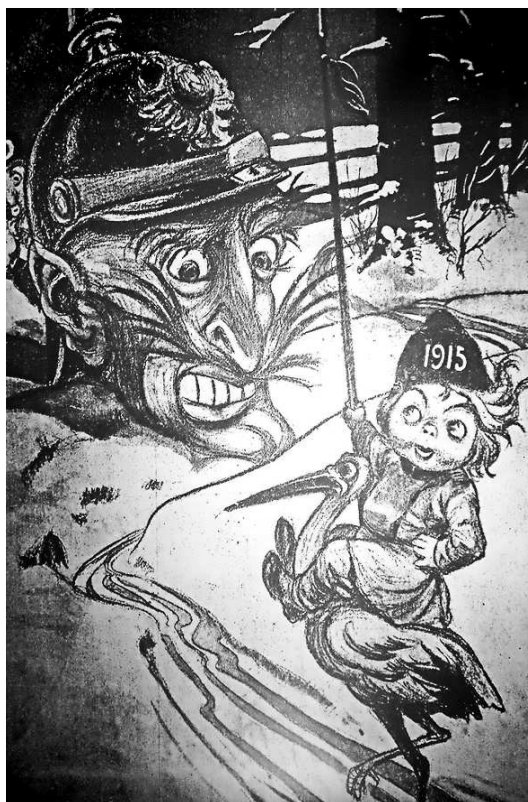
Голова кайзера. Рис. А. Воронецкого (Приазовский край. Иллюстрированное приложение к газете. 1915. 1 января)

Как правило, в донской карикатуре участвовали два главных лица – «свой» (народный герой) и «чужой» (немец, австриец, турок). Немцам приписывались такие качества, как «трусость», «глупость», «заносчивость», «недалекость». В определениях, которые давались немцам вообще, заметно воспроизведение давних стереотипов. Часто повторяется слово «колбасники», подчеркивается приверженность деньгам, бездушие, нахальство и, наконец, неискоренимая