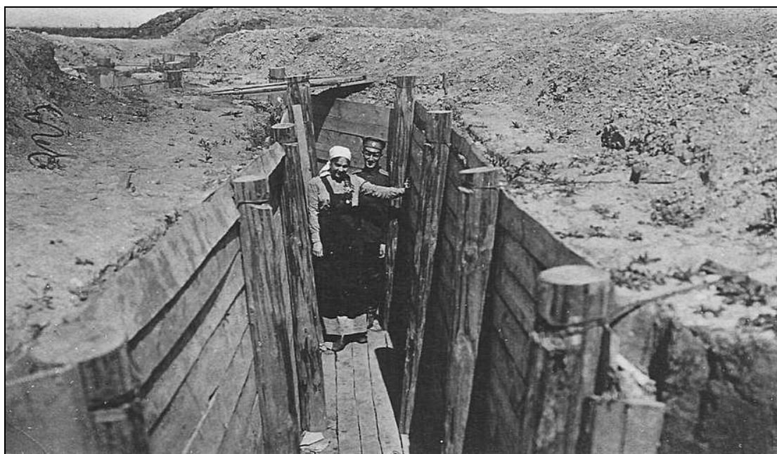
Окоп полного профиля, укрепленный деревянными конструкциями. Село Серединка, Украина. 4 июня 1916 г.