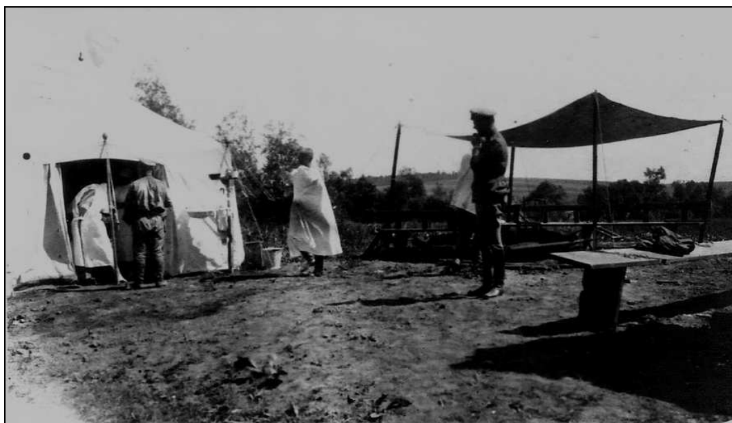
Полевая медсанчасть Передового санитарного поезда Красного Креста № 2. 20 июня 1916 г.