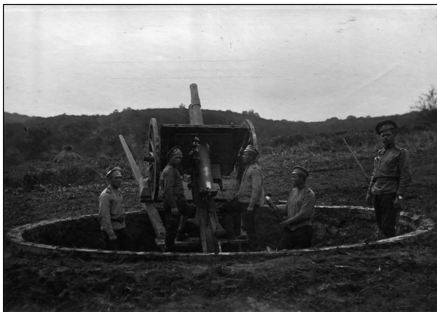
Пушка «Русская трехдюймовка»