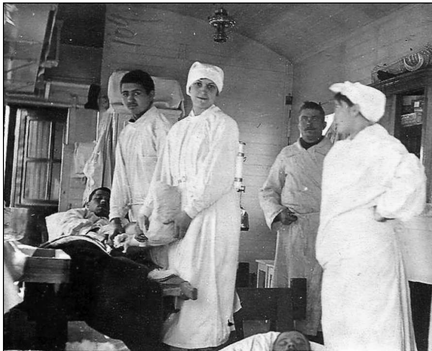
Перевозочный вагон Передового санитарного поезда Красного Креста № 2