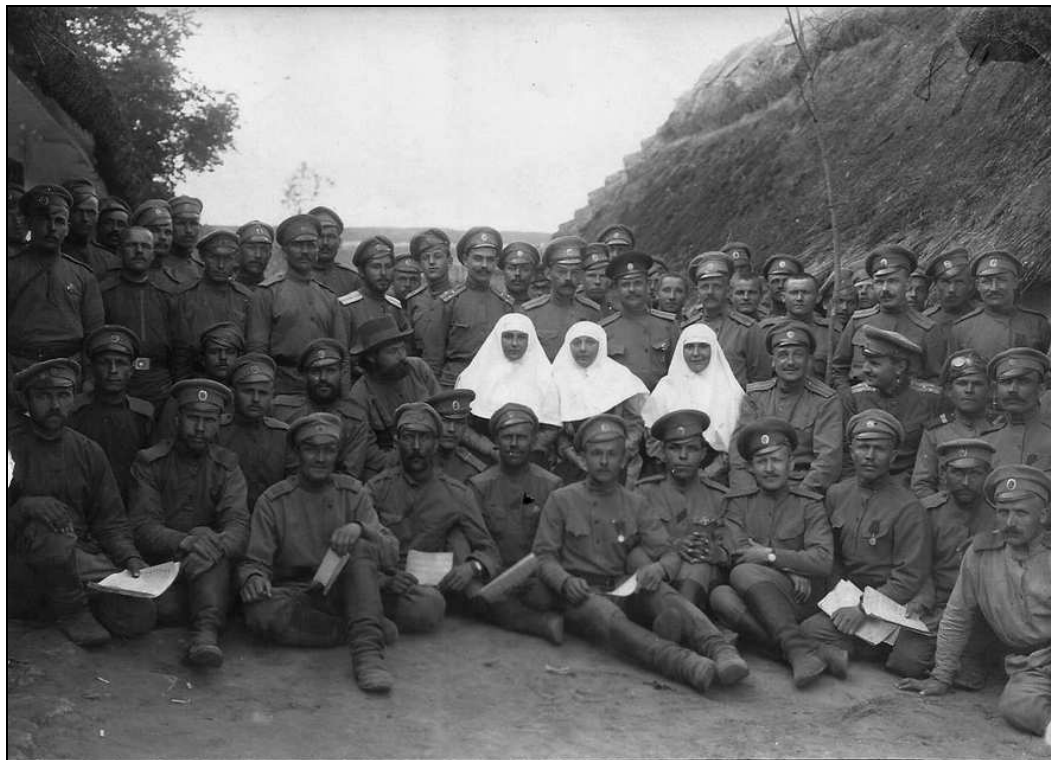
61-й Владимирский полк. Село Долшанка. 15 июня 1916 г.