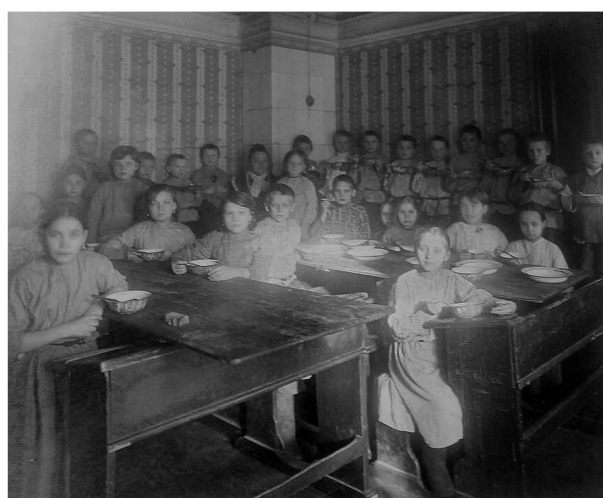
Дети беженцы из яслей-приюта завтракают

Для более эффективного трудоустройства беженцев городское бюро труда было пополнено представителями от военно-промышленного, эстонского, латышского и польского комитетов 17 . Был поставлен вопрос о создании яслей-приюта, который должен был решить две проблемы: позволить женщинам, имеющим маленьких детей, устроиться на работу и обеспечить детям-беженцам, оставшимся без родителей, надлежащий уход.