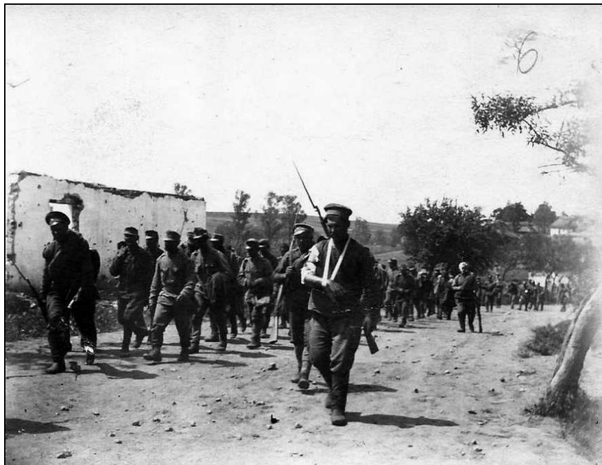
Колонна военнопленных, сопровождаемая ранеными солдатами 61-го пехотного Владимирского полка. Село Куровцы, Украина. 22 мая 1916 г.