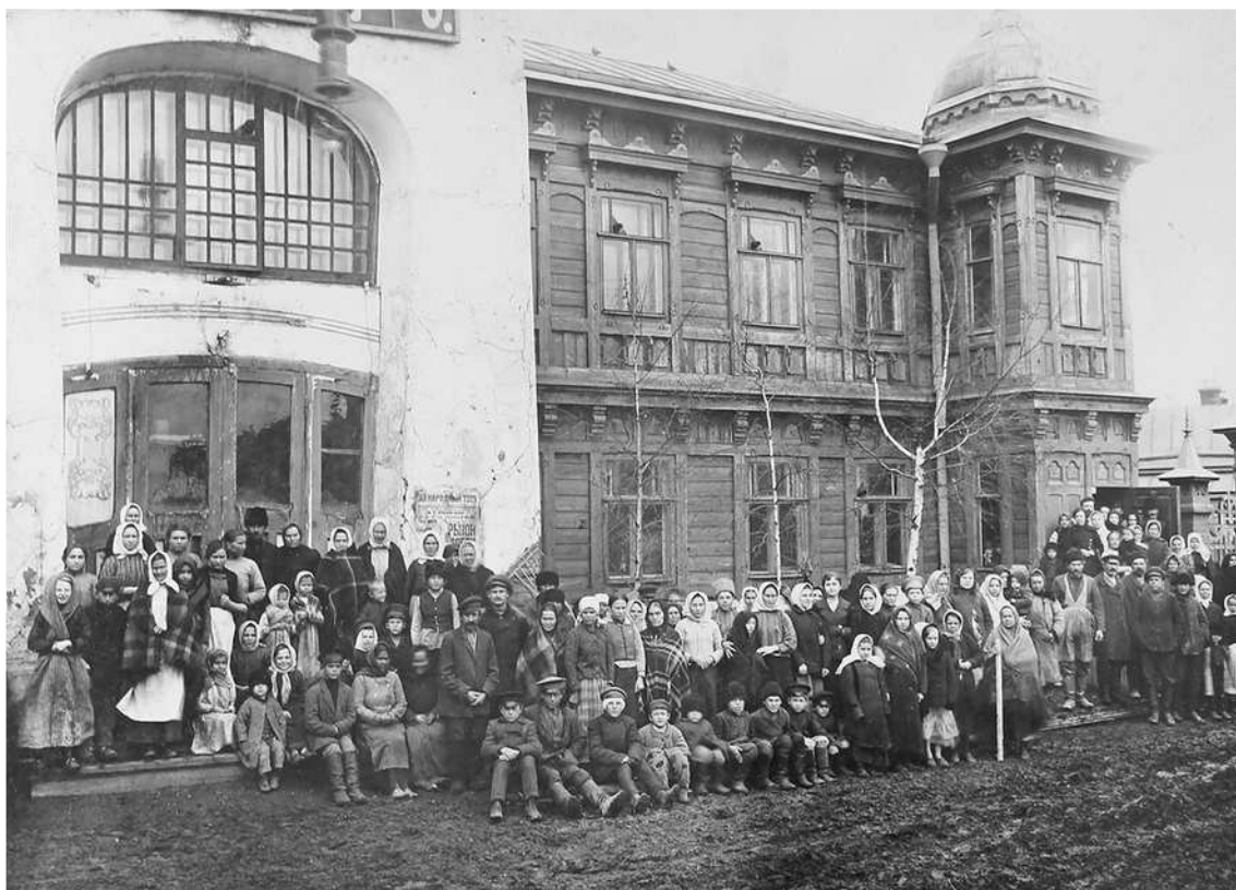
Беженцы поляки и литовцы в Самаре. Убежище в доме близ Аннаевского озера (бывший загородный ресторан «Яр»)

пищей неимущих, принужденных бродить по дачам и просить милостыню» 12 . В городских убежищах устраивались кухни, но газета «Голос Самары» отмечала, что живущие в них беженцы также часто оставались без продовольствия 13 .