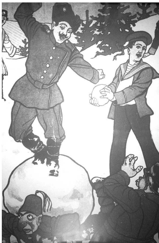
Рождественский выпуск. Рис. А. Воронцового. (Приазовский край. Иллюстрированное приложение к газете. 1914. 25 декабря)

Но не только стереотипы служили основой для визуального отчуждения и высмеивания противников. Навыки художников-физиономистов пригодились донским карикатуристам для изображения низменных чувств, исказивших лица врагов. Кроме того, они умело пользовались таким универсальным средством распознавания народа, как форма носа. Враги изображались с открытыми от изумления ртами (признаком глупости) и длинными «галльскими» носами (что, согласно руководству И.К. Лафатера, есть признак эгоизма, бесчестности, склонности к воровству и развращенности персонажа) 10 . Эффективность такой идентификации персонажа в отечественной карикатуре связана с традициями крестьянской смеховой культуры. Визуальная сатира дореволюционной России дает пример того, как стихия смеха в разные эпохи учитывала социальный заказ, отражала массовые представления о противнике и вписывалась