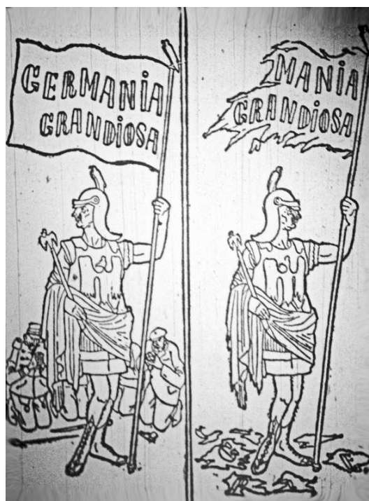
Мечты и действительность (Приазовский край. 1914. 3 сентября)

В русском образованном обществе немец как обобщенный, традиционный образ довоенного периода имел в целом позитивный характер: учитель европейской мудрости, своего рода культуртрегер 6 . Германия длительное время была для России положительным культурным ориентиром, немецкая культура и немецкий язык имели высокую степень значимости для дореволюционной интеллигенции, и потому антигерманские карикатуры были в довоенный период в России большой редкостью. Даже в начале Первой мировой войны ситуация в России существенно не изменилась. Хотя на этом этапе Германия в донских карикатурах аллегорически изображалась в виде жадной до денег, с манией величия женщины, высмеивалась ее любовь к расчетной книжке, но никаких непосредственных целей демонизации здесь