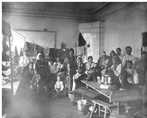
Беженцы-поляки в доме купца Дочара

Непосредственно польские беженцы проживали в убежище на углу Заводской и Вознесенской улиц в доме католика купца Дочара, в убежище в здании бывшего загородного ресторана «Яр» близ Аннаевского озера, в последнем – вместе с беженцами-литовцами. Более 1 тыс. чел. из Ломжинской, Сувалкской и Волынской губерний разместили в кумысолечебном заведении Постникова 11 . Вот как описывалась жизнь беженцев на даче Постникова в газете «Волжский день»: «Все, и маленькие и большие, здания, разбросанные по всему парку, заняты беженцами..., внесшими большое оживление в омертвевшую уже усадьбу. К сожалению, предоставив дома для размещения беженцев, до сих пор не позаботились об устройстве кухни и все население курорта вынуждено готовить себе немудрую еду, разводя костры. Плохо организовано также и дело снабжения