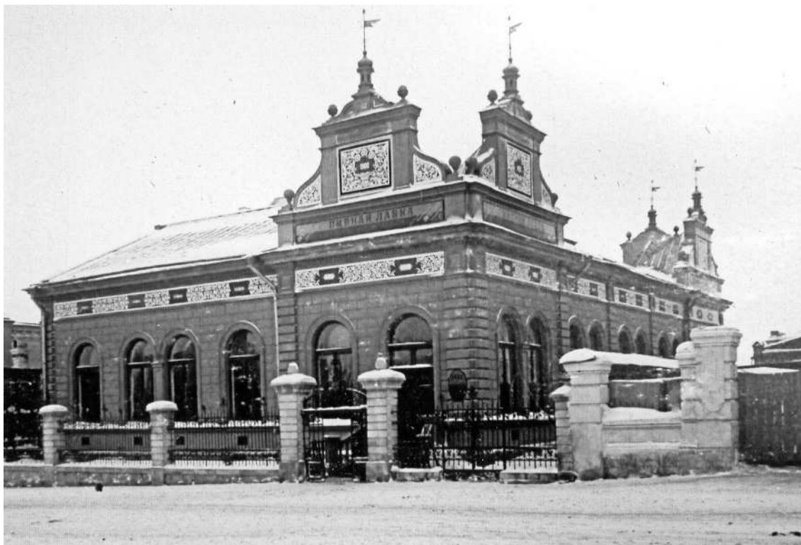
Пивная Альфреда фон Вакано в г. Самаре, переоборудованная под лазарет для пленных турок