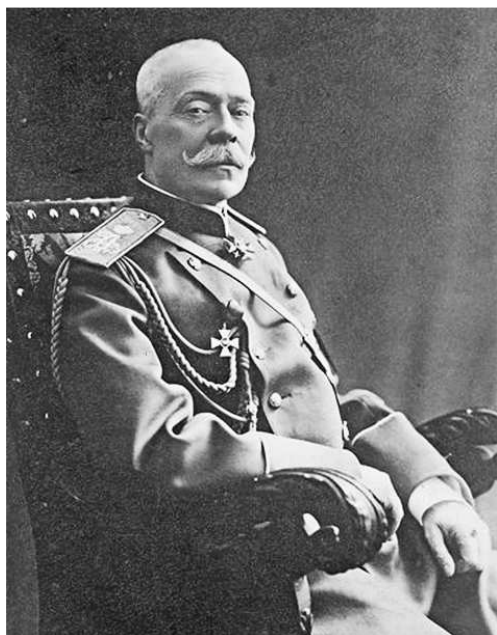
Принц А.П. Ольденбургский

В дальнем углу этого салона стоял, прислонившись к стенке, скрестив на груди руки, довольно высокого роста, крупного телосложения человек, одетый в генерал-адъютантскую, цвета хаки, однобортную тужурку с георгиевским крестом в петличке. Все мы тотчас же догадались, что стоим перед самым принцем. При виде нас он отрывисто бросил: