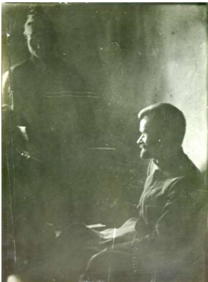
Полковник А.П. Перхуров – организатор июльского восстания 1918 г. в Ярославле

Ярославской губернии и главнокомандующим Добровольческой армии Северного фронта. Восставшие организовали «Гражданское управление», восстановили «Городскую управу». Были произведены аресты и расстрелы руководителей советских учреждений. 20 июля, после окружения советскими войсками, штаб Перхурова, не признавший Брестский мир и официально находившийся в состоянии войны с Германией, сдался в плен германской комиссии по руководству эвакуацией военнопленных немцев во главе с лейтенантом Балком. Комиссия располагалась в Ярославле и, согласно условиям Брестского мира, занималась организацией выезда оставшихся немцев на родину. Балк гарантировал сдавшимся безопасность, однако 21 июля передал военнопленных советским войскам 5 . Восстание было полностью ликвидировано. Оно стало одним из крупнейших выступлений против советской власти в 1918 г.