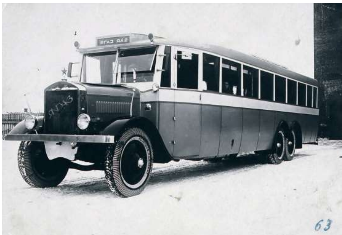
Автобус ЯА-2, 100-местный, 3-х осный, для Ленинграда. 1934 г.