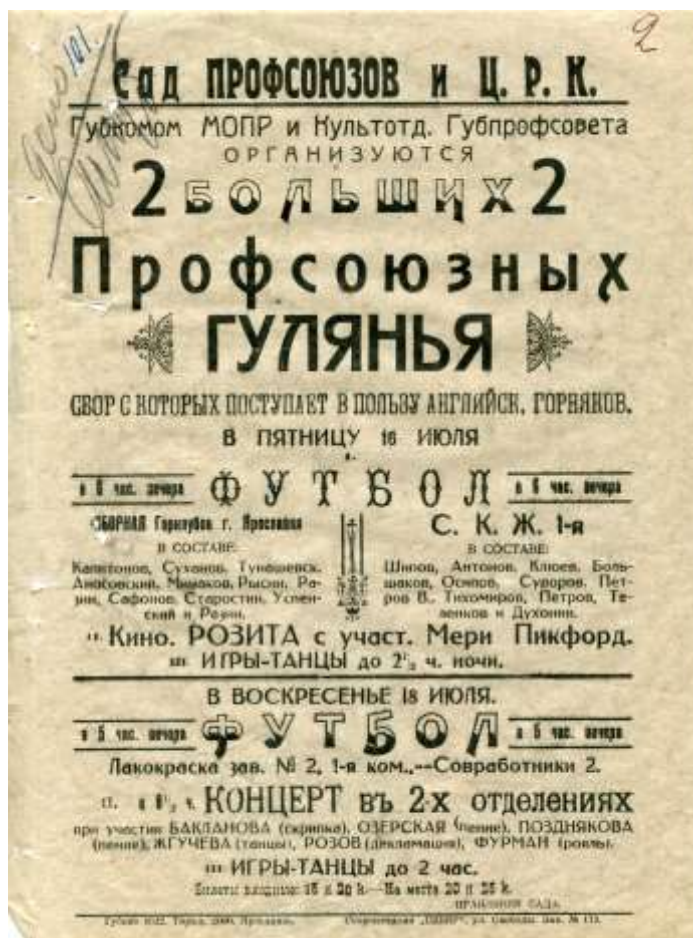
Афиша профсоюзных гуляний, организованных в помощь английским горнякам. 1926 г. (ЦДНИ ГАЯО. Ф. 1087. Оп. 1. Д. 455. Л. 2)

Также профсоюзными организациями губернии для детей бастующих горняков был организован сбор средств среди работников ярославских предприятий 16 . При Ярославском губпрофсовете в августе 1926 г. был создан губернский комитет работников «Помощи детям английских углекопов». Его работа проходила под лозунгом: «Помоги детям угля, детям бастующих горняков Англии» 17 . Комитет состоял из 25 работников всех крупных предприятий города. Для изыскания средств по губернии проводились гуляния, вечера, кинопоказы, сбор от которых поступал в помощь детям бастующих. Были разработаны для реализации специальные значки помощи английским горнякам. В сентябре – ноябре в губернии при поддержке профсоюзных организаций были проведены трехдневники помощи семьям английских углекопов. В эти дни учреждения культуры отчисляли средства с проданных билетов в пользу английских горняков, а учреждения общепита, торговавшие крепкими алкогольными напитками, обязаны были продавать их по повышенной стоимости, также перечисляя полученную разницу на счета ВЦСПС 18 . За май – октябрь 1926 г. по всем профсоюзным