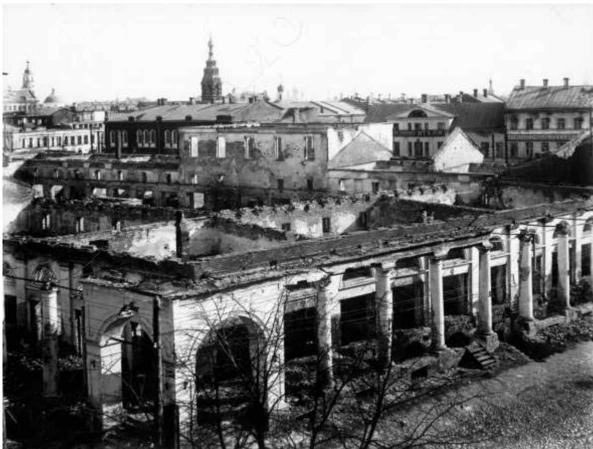
Разрушенные во время июльских событий 1918 г. торговые ряды; дома по улице Первомайской (бывшая Гостиный ряд).

Таким образом вопрос о финансовых претензиях Западных держав был закрыт. С момента подавления Ярославского восстания началось постепенное укрепление советской власти в Ярославской губернии. Ярославцы больше не становились непосредственными активными участниками событий международной жизни, однако жители региона опосредованно продолжили участвовать в международных делах в основном через участие в массовых агитационно-пропагандистских кампаниях.