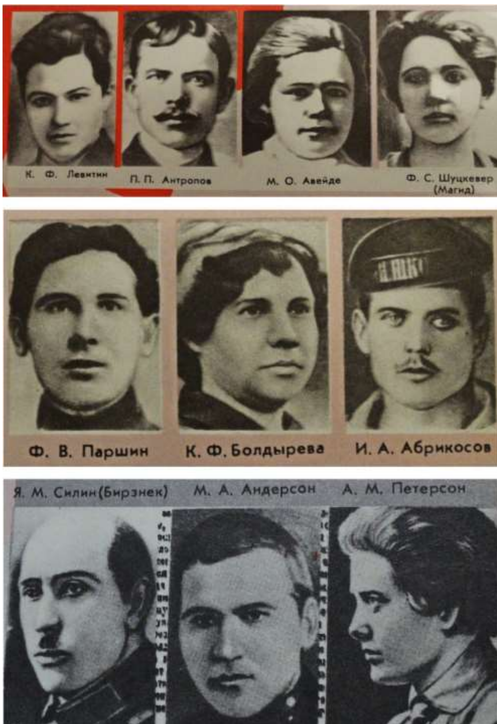
Члены Самарского подпольного комитета большевиков при Комуче в 1918 г.