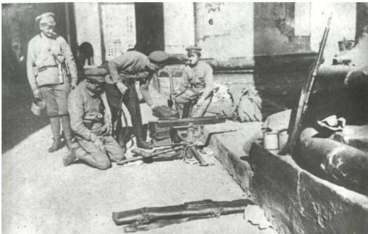
Группа советских пулеметчиков на боевых позициях, июль 1918 г.

Материальный ущерб от июльских событий был столь значительным, что был использован большевиками для маневров во время переговоров со странами Западной Европы на Генуэзской конференции в апреле 1922 г. Бывших союзников царской России интересовал вопрос о признании большевиками финансовых обязательств царского и временного правительств, как в отношении иностранных государств, так и в отношении иностранных граждан. Во время переговоров советское правительство не уступило ни по одному из вопросов, выдвинув финансовые контрпретензии и выставив счета «за танки генерала Корнилова и за подавление Ярославского мятежа» 6 .