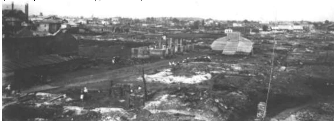
Разрушенный город Ярославль после июльских событий 1918 г.

Материальный ущерб от июльских событий был столь значительным, что был использован большевиками для маневров во время переговоров со странами Западной Европы на Генуэзской конференции в апреле 1922 г. Бывших союзников царской России интересовал вопрос о признании большевиками финансовых обязательств царского и временного правительств, как в отношении иностранных государств, так и в отношении иностранных граждан. Во время переговоров советское правительство не уступило ни по одному из вопросов, выдвинув финансовые контрпретензии и выставив счета «за танки генерала Корнилова и за подавление Ярославского мятежа» 6 .