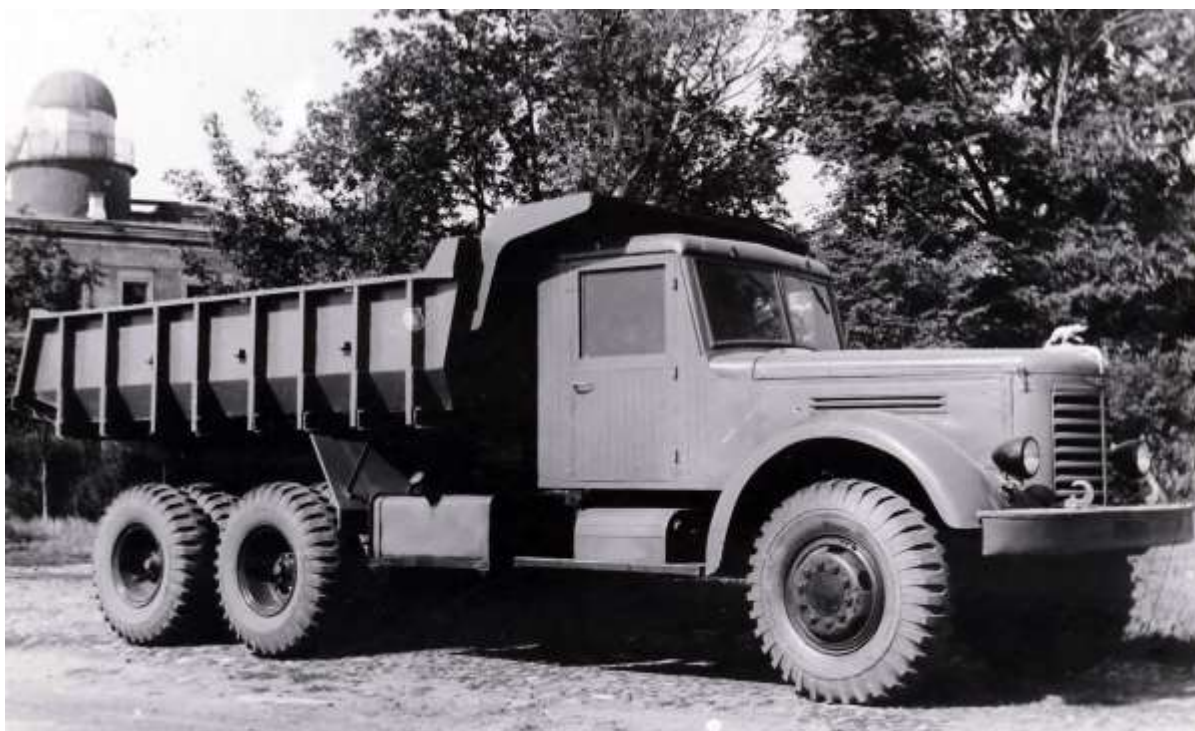
ЯАЗ-210 Е. Автомобиль самосвал, 3-х осный, грузоподъемностью 10 тонн. 1950 г.