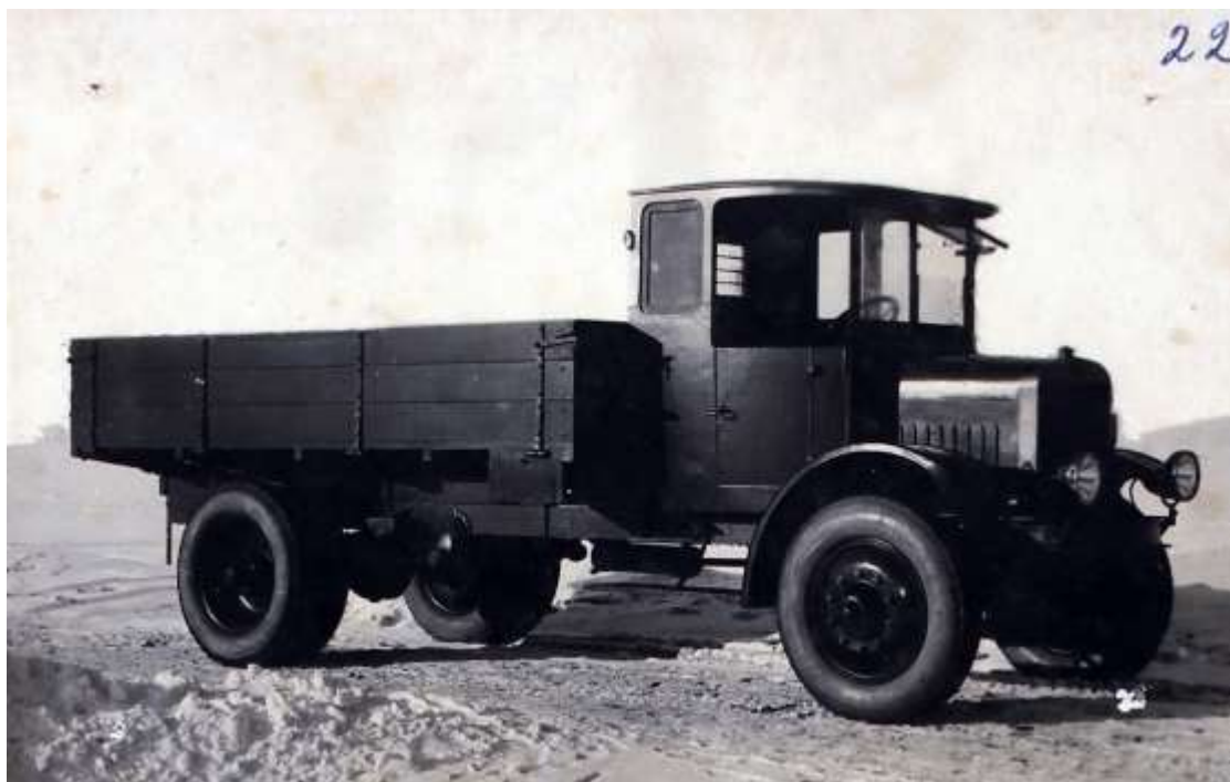
Автомобиль Я-3 грузовой, бортовой, 2-х осный, 3 тонный. 1925 г.

Документы публикуются в хронологическом порядке.