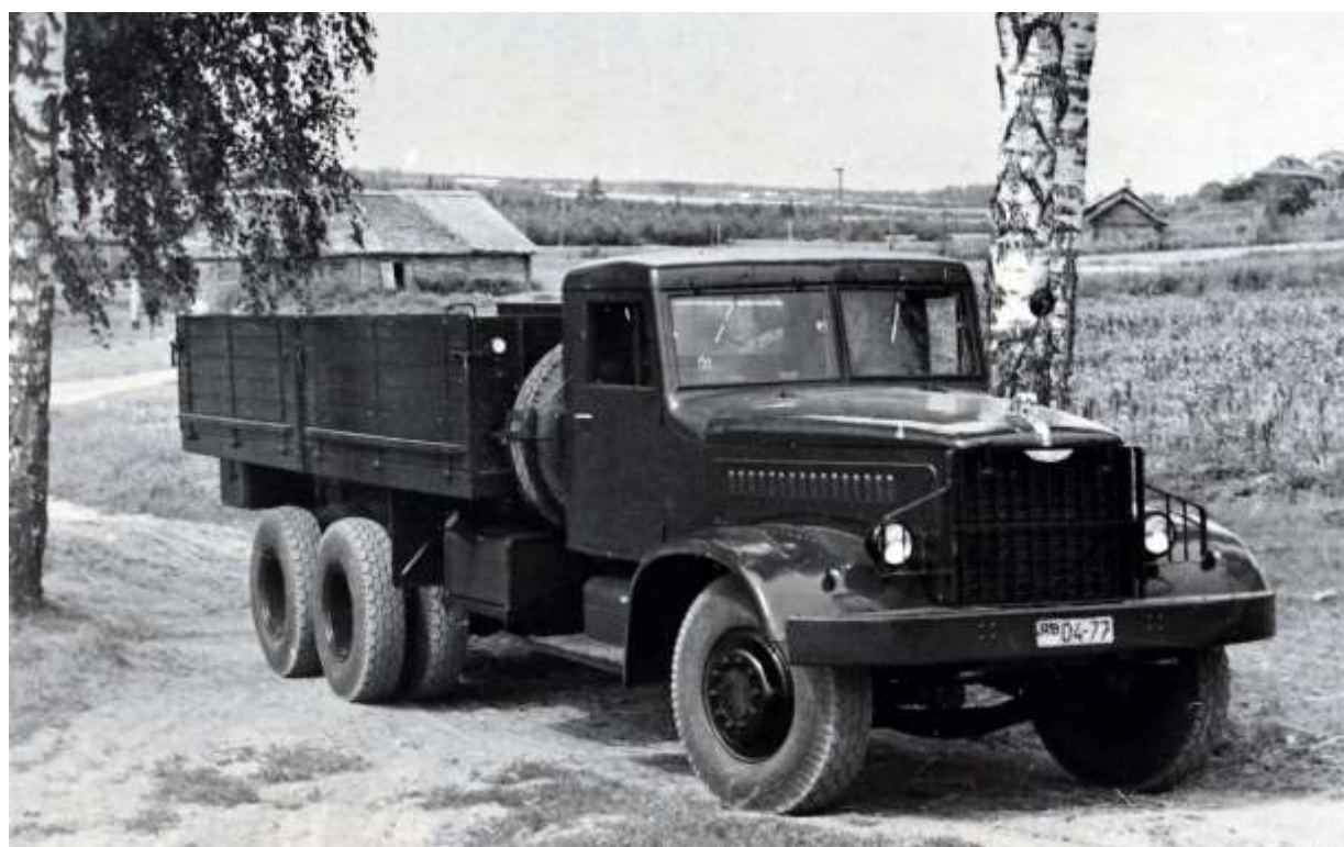
ЯАЗ-219. Автомобиль грузовой, 3-х осный, с деревянной платформой, грузоподъемностью 12 тонн. 1957 г.