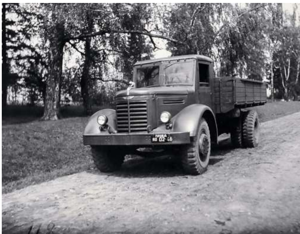
ЯАЗ-200. Автомобиль в пробеге. 1947 г.