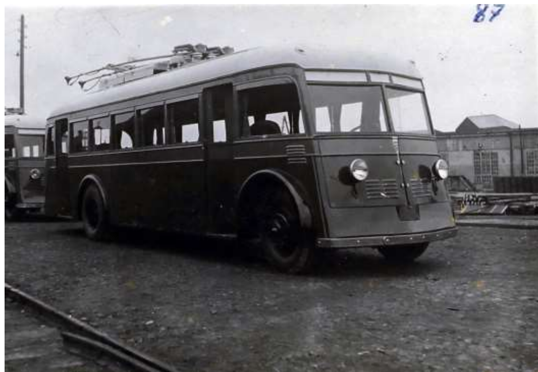
ЯТБ-1. Первые троллейбусы, одноэтажные, пассажирские, на 55 мест. 1936 г.