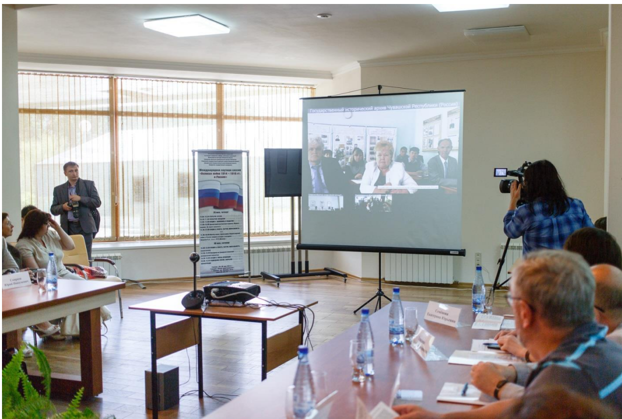
Международная научная сессия «Великая война 1914–1918 гг. и Россия» (Самара, 29 – 30 мая 2014 г.). На связи – дистанционная площадка сессии в Государственном историческом архиве Чувашской Республики (Россия, г. Чебоксары)

Состоявшаяся Всероссийская конференция «Россия в условиях Первой мировой войны, Революции и Гражданской войны (1914–1920 гг.)» (1–2 июня 2017 года) объединила историков, общественных и политических деятелей, а также представителей музеев, архивов, библиотек из более чем двух десятков городов. Приветствие конференции направили председатель Российского исторического общества и губернатор Самарской области. Наряду с обсуждением проблем Первой мировой войны, большое внимание было уделено проблемам истории 1917 года и Гражданской войны. Также в рамках конференции прошла презентация историко-документальной выставки «1917 год в Самарской губернии: люди, общество, жизнь». Экспозиция была подготовлена Самарской областной научной библиотекой совместно с Центральным государственным архивом Самарской области.