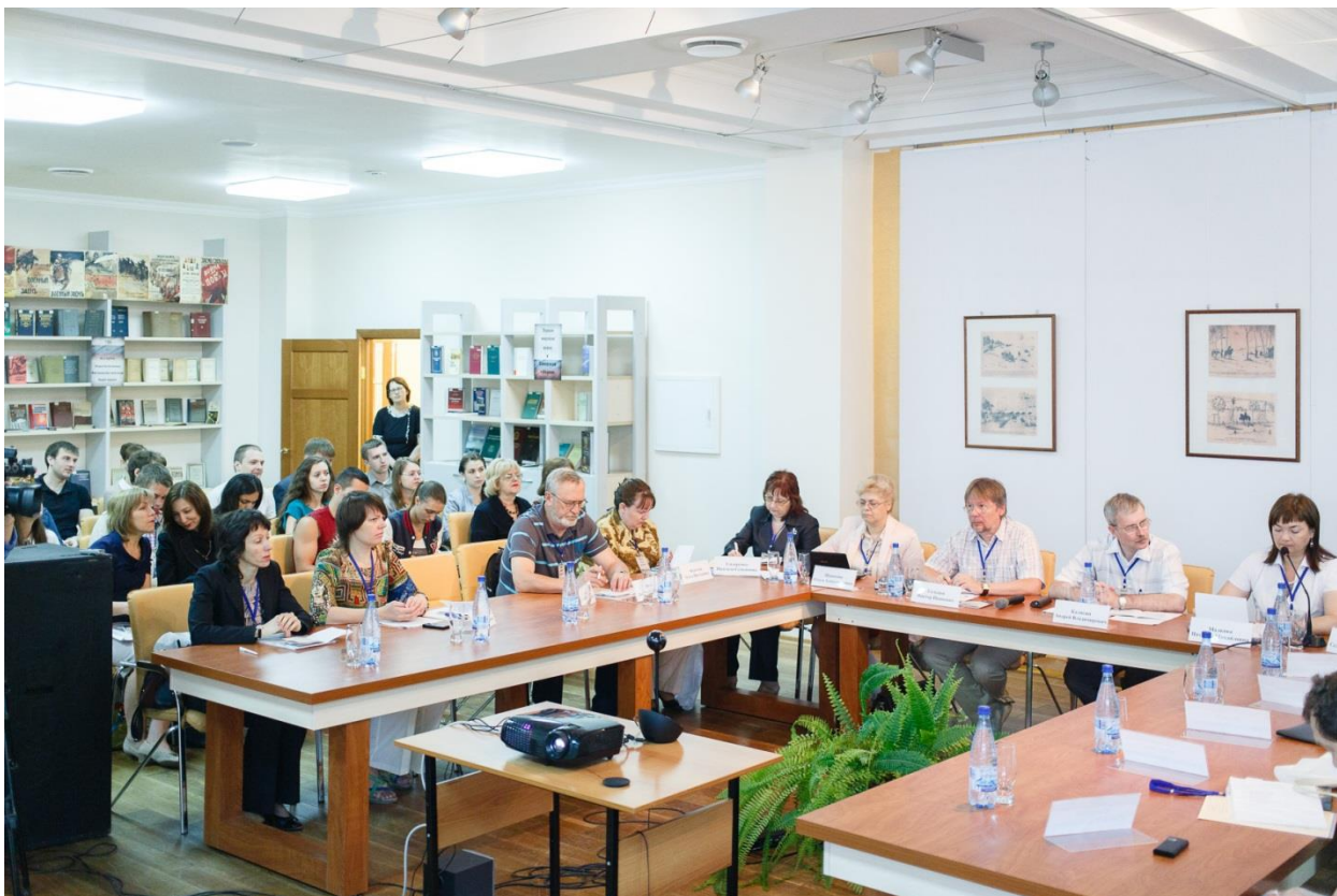
Заседание Международной научной сессии «Великая война 1914–1918 гг. и Россия» (Самара, 29 – 30 мая 2014 г.)