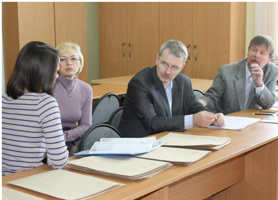
Рабочий момент создания сборника.