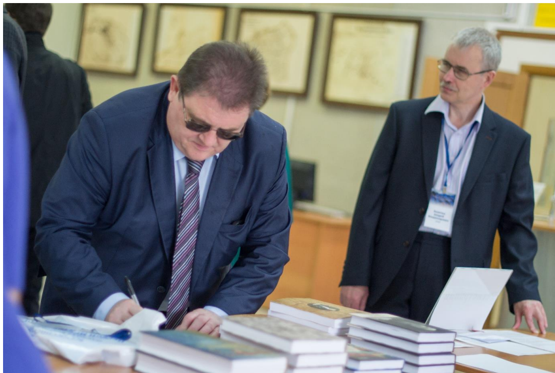
Всероссийская научная конференция «Пятое Гротовские чтения». Регистрация участников. 15 ноября 2018 г.