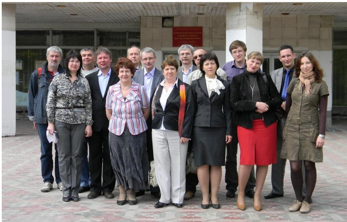
Участники Международной научной конференции «Великая война 1914–1918 годов и Россия». 4 мая 2012 г.