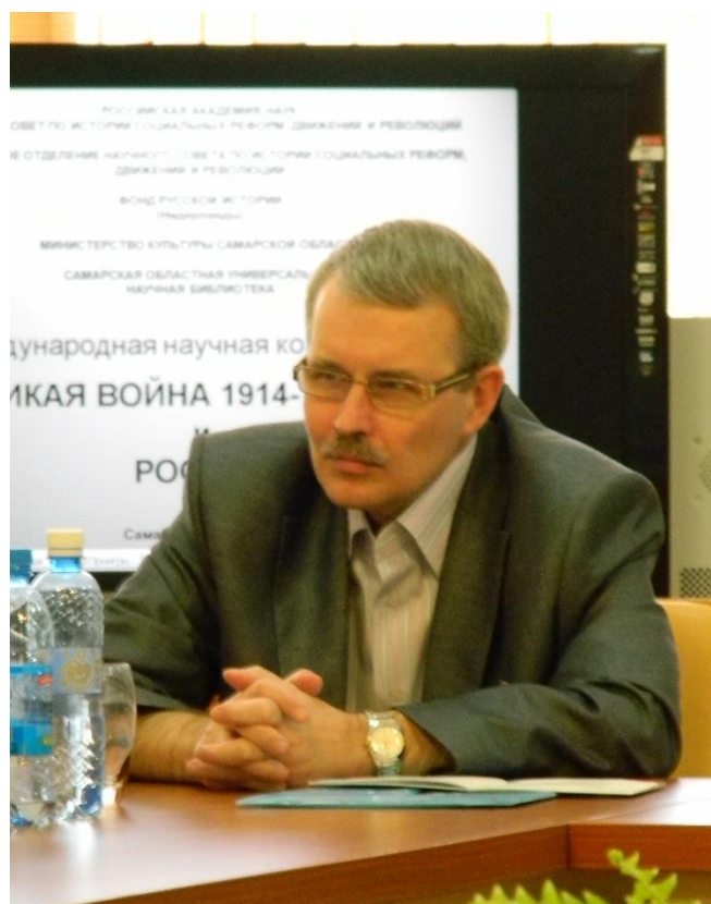
Международная научная конференция «Великая война 1914–1918 гг. и Россия». 3 мая 2012 г. Заседание секции.