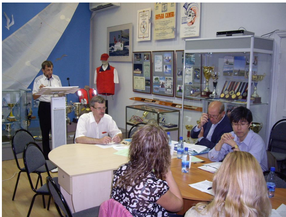
Международный коллоквиум в Саратове. 2008 г.