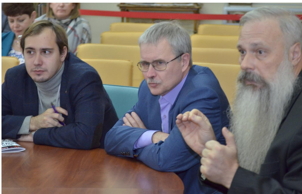
Всероссийская научная конференция «Пятое Гротовские чтения». Круглый стол «Гротовские чтения – 2020: новые горизонты». 16 ноября 2018 г.