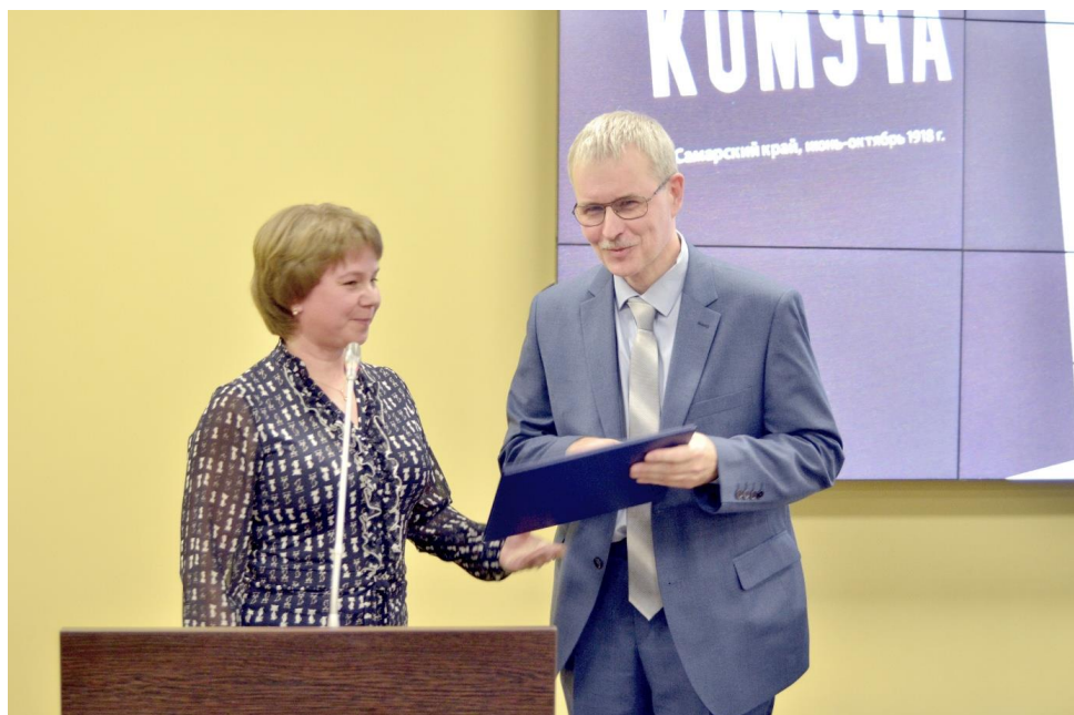
Презентация сборника документов и материалов «Под знаменем Кому́ча (Самарский край, июнь – октябрь 1918 г.)». 22 ноября 2018 г. Вручение приветственного адреса министра культуры Самарской области