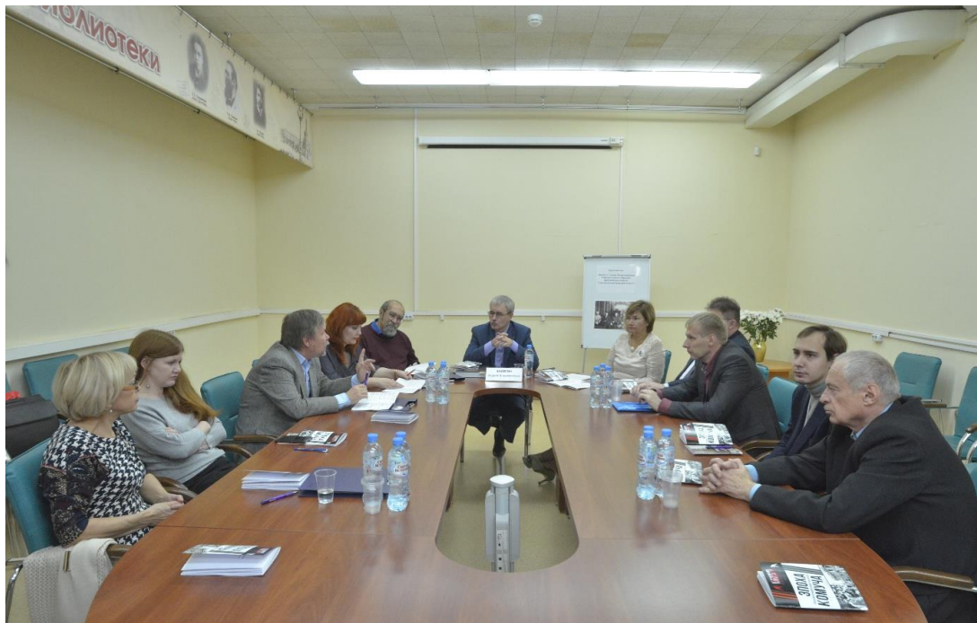
Всероссийская научная конференция «Пятое Гротовские чтения». Заседание круглого стола «Комитет членов Всероссийского Учредительного собрания: проблема реальности "учредилловской альтернативы"». 16 ноября 2018 г.