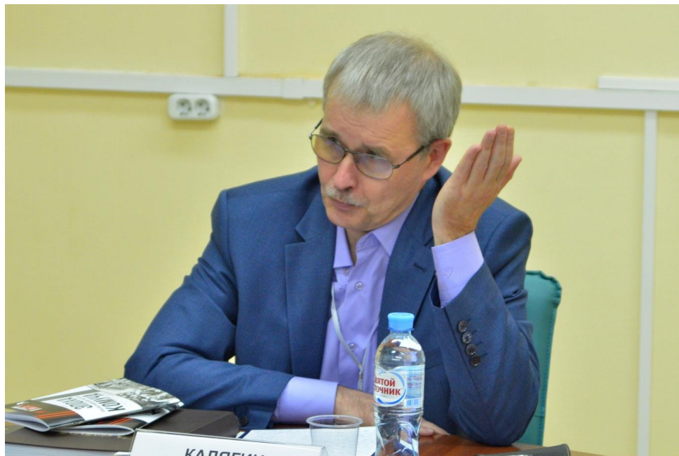
Всероссийская научная конференция «Пяты́е Гротовские чтения». Заседание круглого стола «Комитет членов Всероссийского Учредительного собрания: проблема реальности "учредилловской альтернативы"». 16 ноября 2018 г.