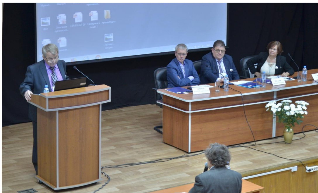
Всероссийская научная конференция «Пятое Гротовские чтения». Пленарное заседание. 15 ноября 2018 г.