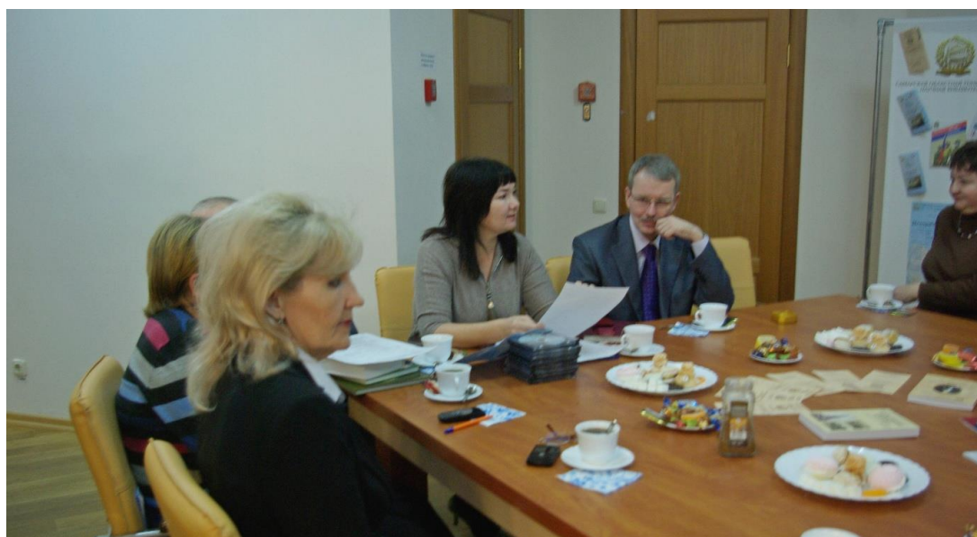
ГБУК «СОУНБ», итоговый круглый стол по закрытию «Исторических сезонов». 2012 г.